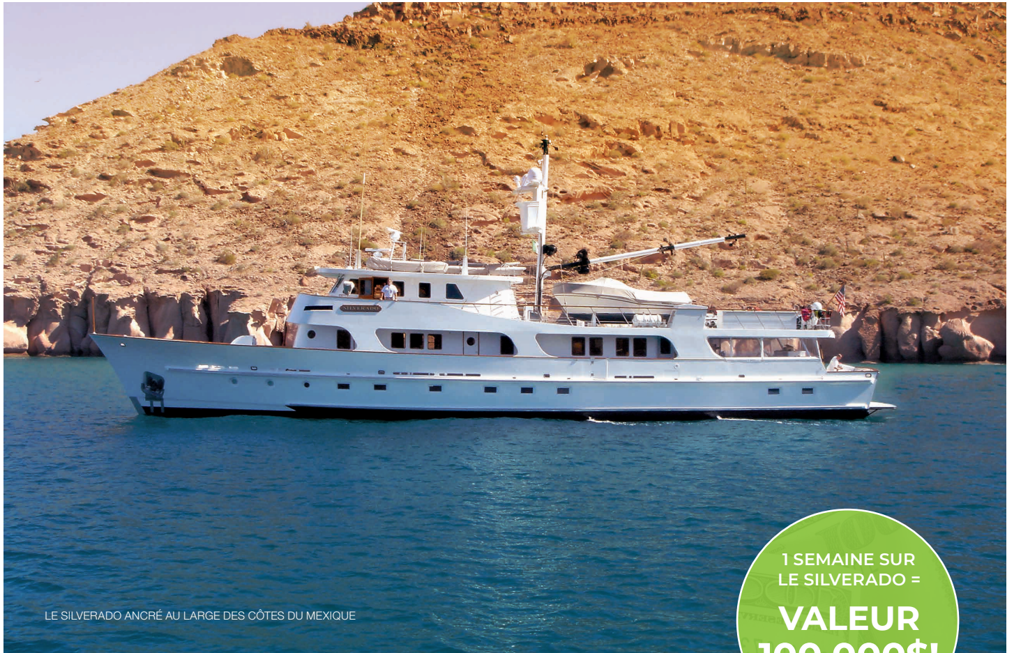
LE SILVERADO ANCRÉ AU LARGE DES CÔTES DU MEXIQUE