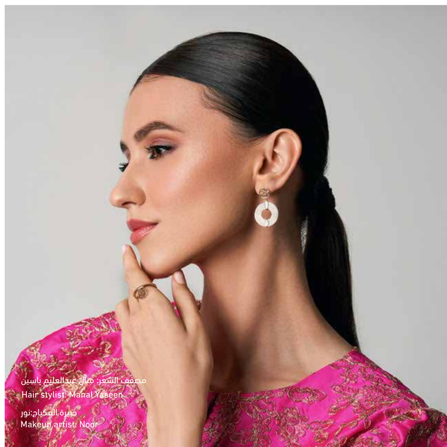
مصفف الشعر: منال عبدالعليم ياسين Hair stylist: Manal Yaseen خبيرة المكياج: نور Makeup artist: Noor