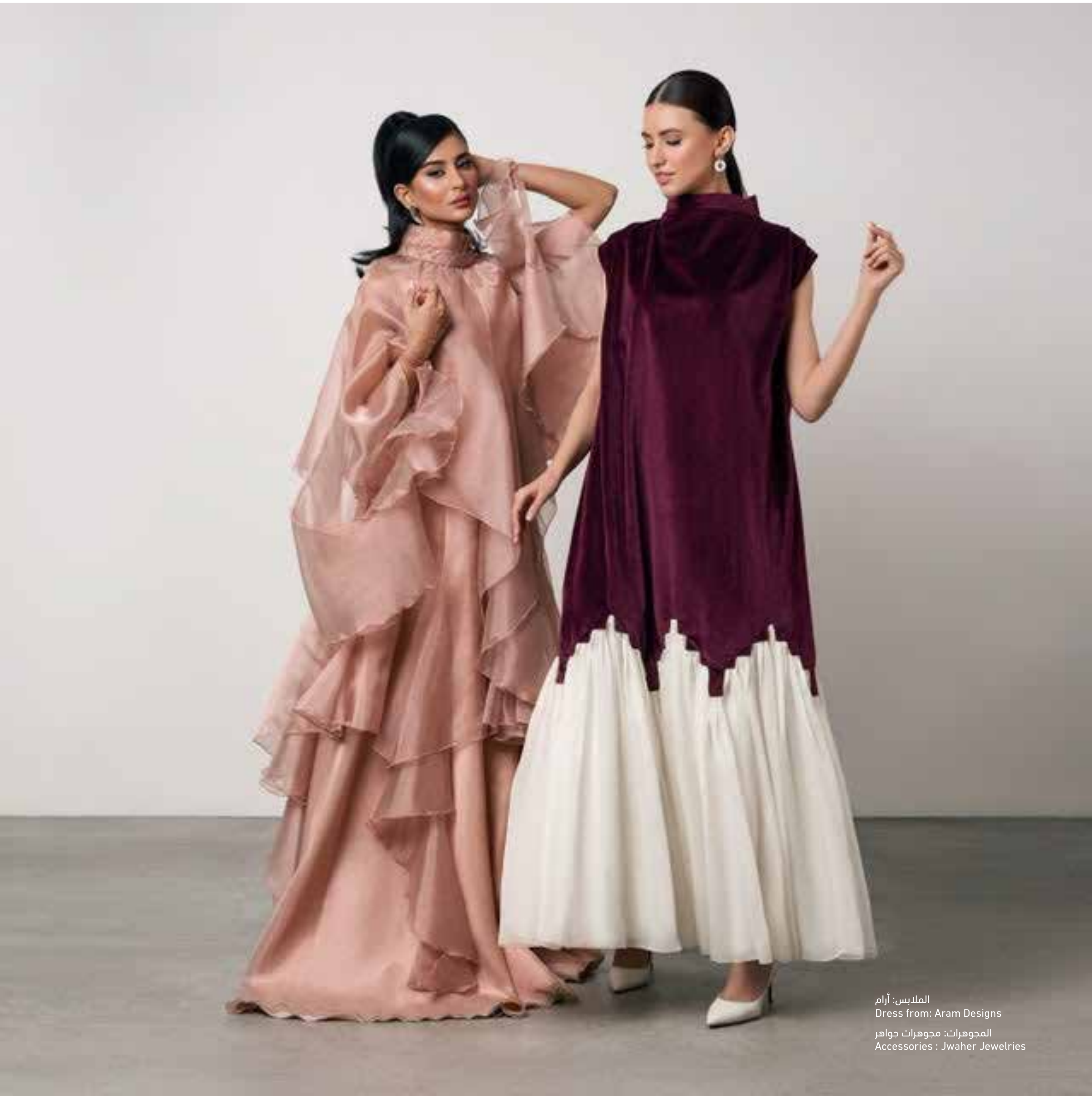
الملبس: آرام Dress from: Aram Designs المجوهرات: مجوهرات جواهر Accessories : Jwaheer Jewelries