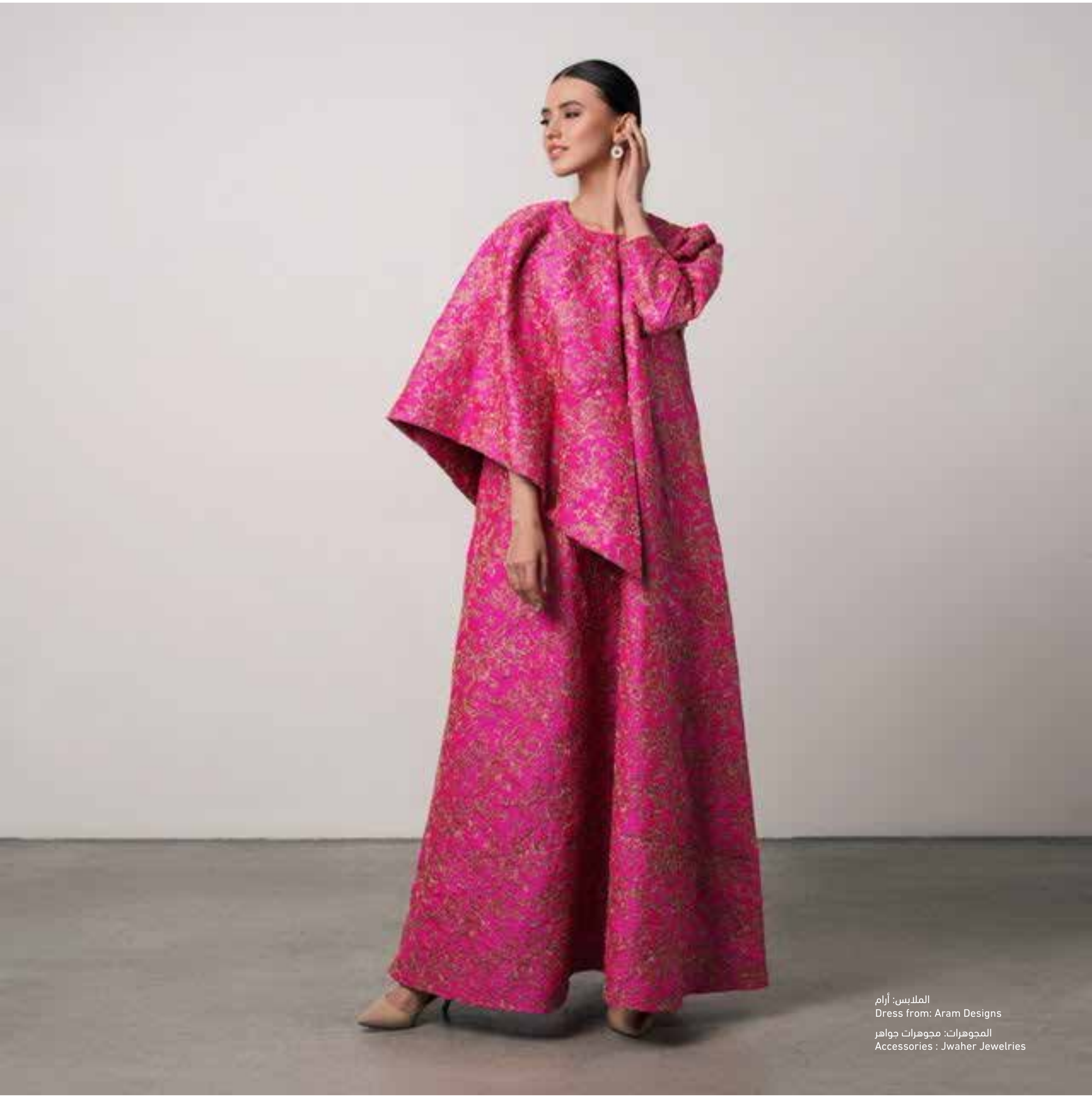
الملبس: آرام Dress from: Aram Designs المجوهرات: مجوهرات جواهر Accessories : Jwahr Jewelries