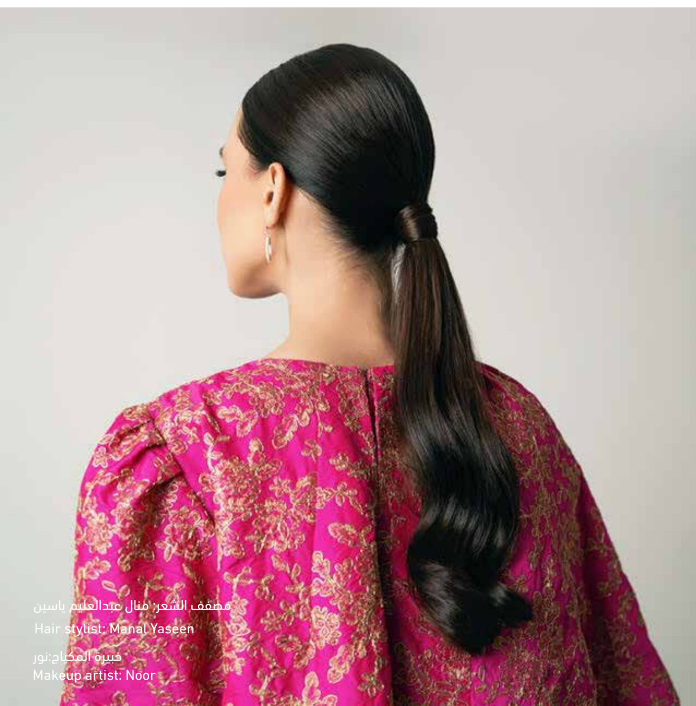
مصفف الشعر: منال عبدالعليم ياسين Hair stylist: Manal Yaseen خبيرة المكياج: نور Makeup artist: Noor