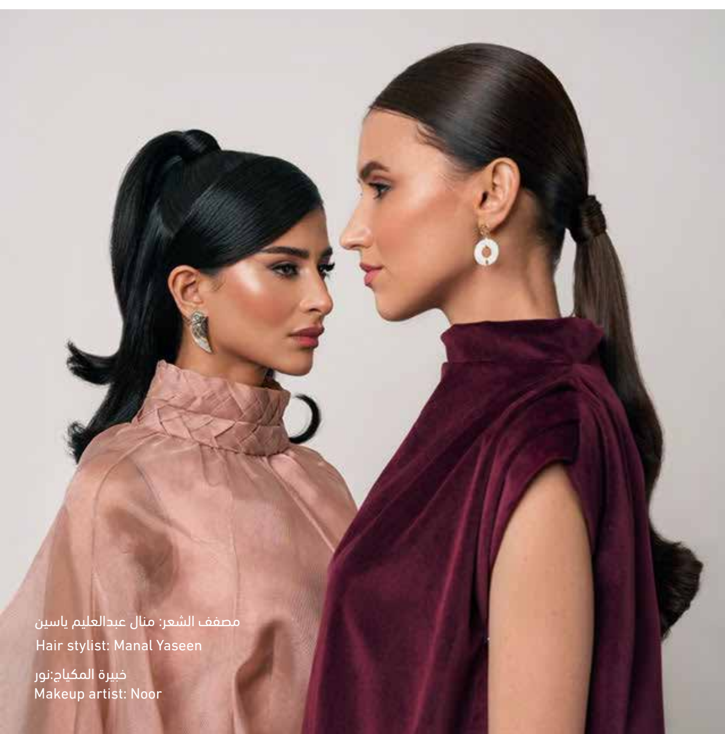
مصفف الشعر: منال عبدالعليم ياسين Hair stylist: Manal Yaseen خبيرة المكياج: نور Makeup artist: Noor