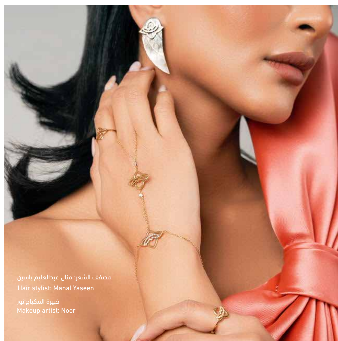
مصفف الشعر: منال عبدالعليم ياسين Hair stylist: Manal Yaseen خبيرة المكياج: نور Makeup artist: Noor