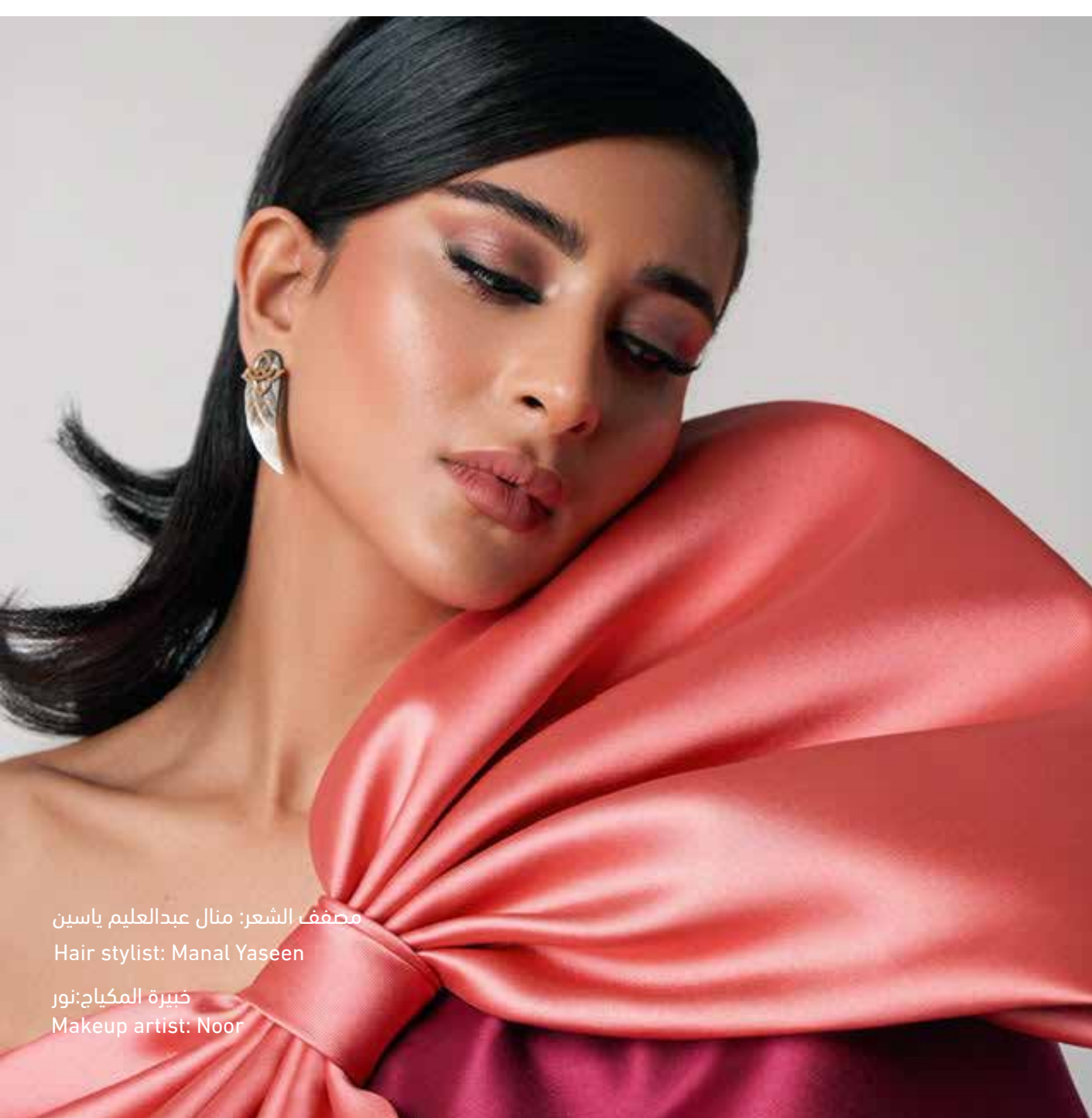
مصفف الشعر: منال عبدالعليم ياسين Hair stylist: Manal Yaseen خبيرة المكياج: نور Makeup artist: Noor