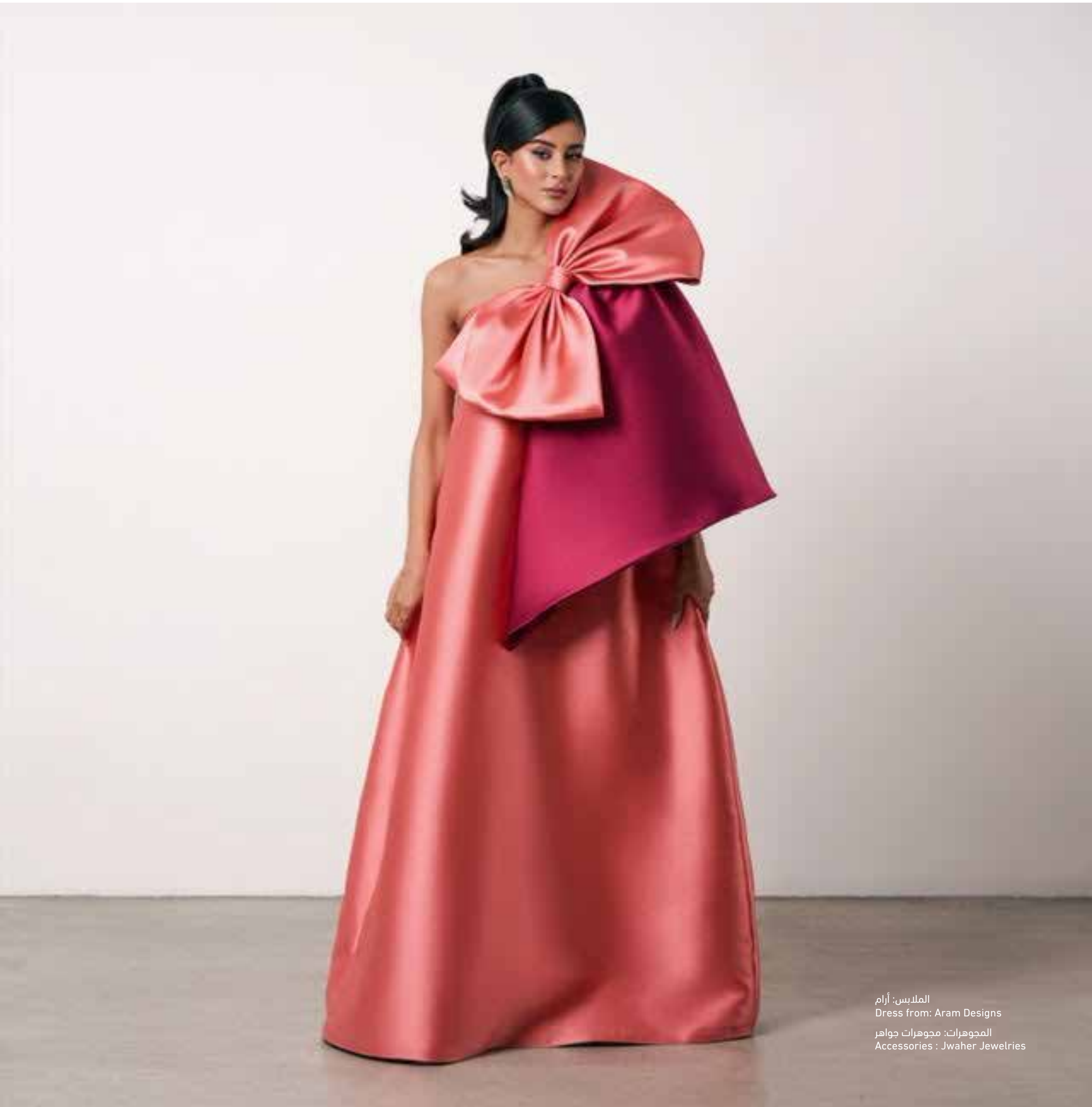
الملابس: آرام Dress from: Aram Designs المجوهرات: مجوهرات جواهر Accessories : Jwahr Jewelries