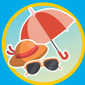
於戶外活動時 請記得使用護眼三寶