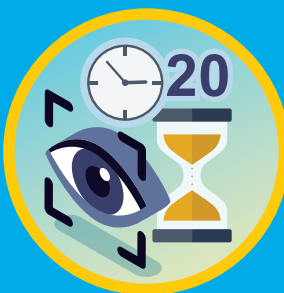
遵從20-20-20法則 適時讓眼睛休息