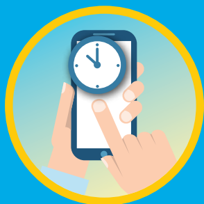
控制使用電子產品時間