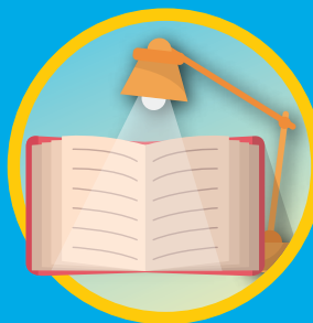
閱讀時要有充足光線