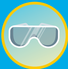
高風險活動時 請確保佩戴適當的防護裝備