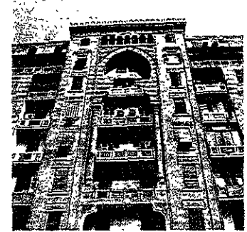
تفاصيل شرفات المبنى

يرجع تاريخ إنشاء هذا المبنى إلى عام ١٩٣٠م في وسط المدينة والتي أطلق عليها قاهرة الإسماعيل نسبة إلى الخديوي إسماعيل على مساحة ٩٥٠ متر مربع في ٥٥ شارع الجمهورية على ناصية تقاطع شارع الجمهورية مع شارع المالكي .