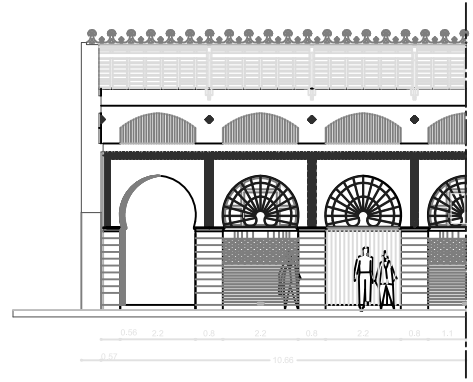
Au Niveau du Passage Latéral Droit Marché aux poissons/Galerie Volailles