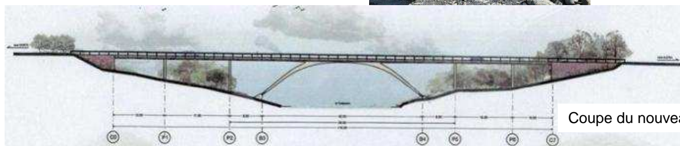
Coupe du nouveau pont