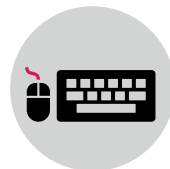
teclados e mouse