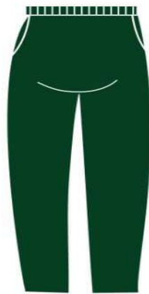
CALÇA TACTEL FEMININA