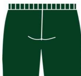
BERMUDA TACTEL MASCULINA