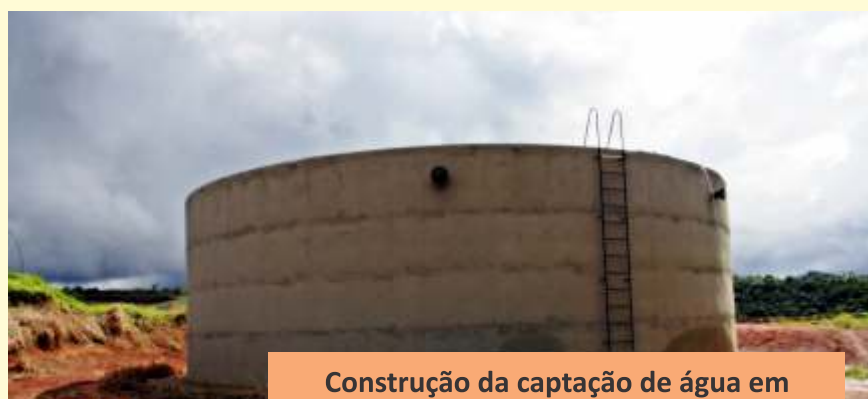
Construção da captação de água em Alto Caxixe.