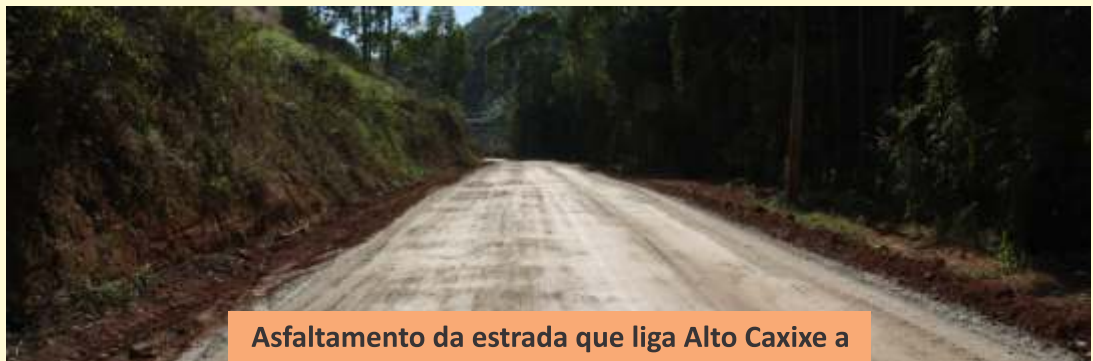
Asfaltamento da estrada que liga Alto Caxixe a Forno Grande.

A administração municipal sempre buscando o bem estar da sua população. Obras sendo iniciadas e concluídas.