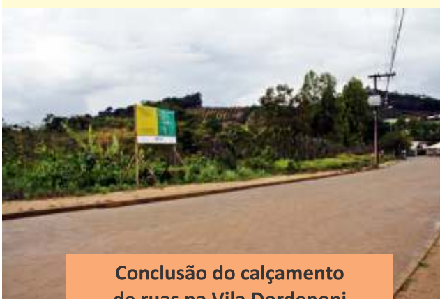
Conclusão do calçamento de ruas na Vila Dordenoni - Alto Caxixe.

A região também será contemplada com a elaboração de projetos para asfaltamento dos trechos: São José do Alto Viçosa X Bela Aurora e Braço do Sul via condomínio Monte Blu.