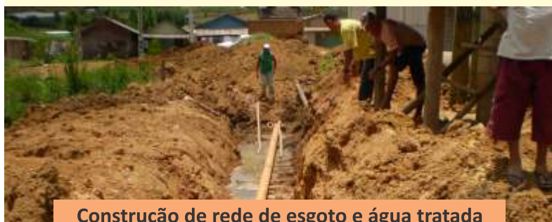
Construção de rede de esgoto e água tratada na Vila Barbosa, São José do Alto Viçosa.

A administração municipal sempre buscando o bem estar da sua população. Obras sendo iniciadas e concluídas.