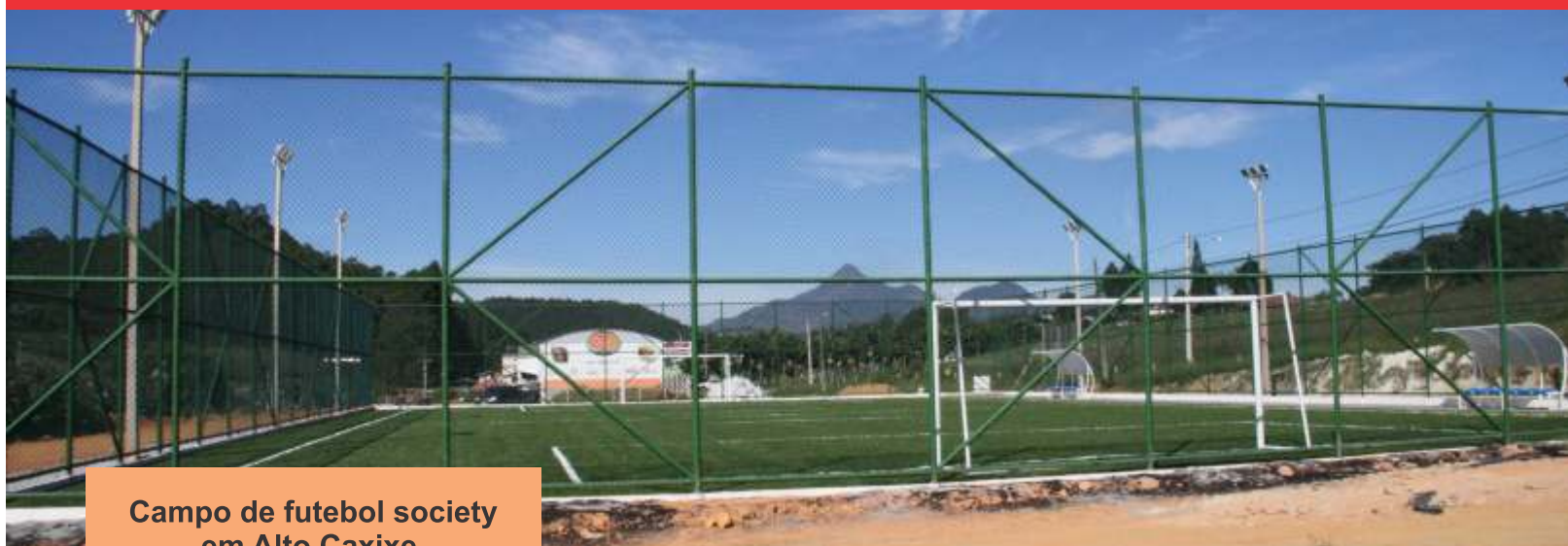
Campo de futebol society em Alto Caxixe.