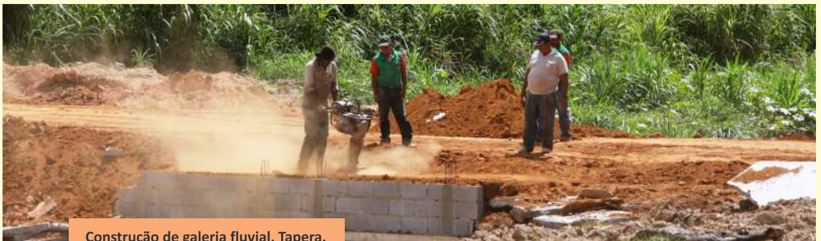
Construção de galeria fluvial, Tapera.