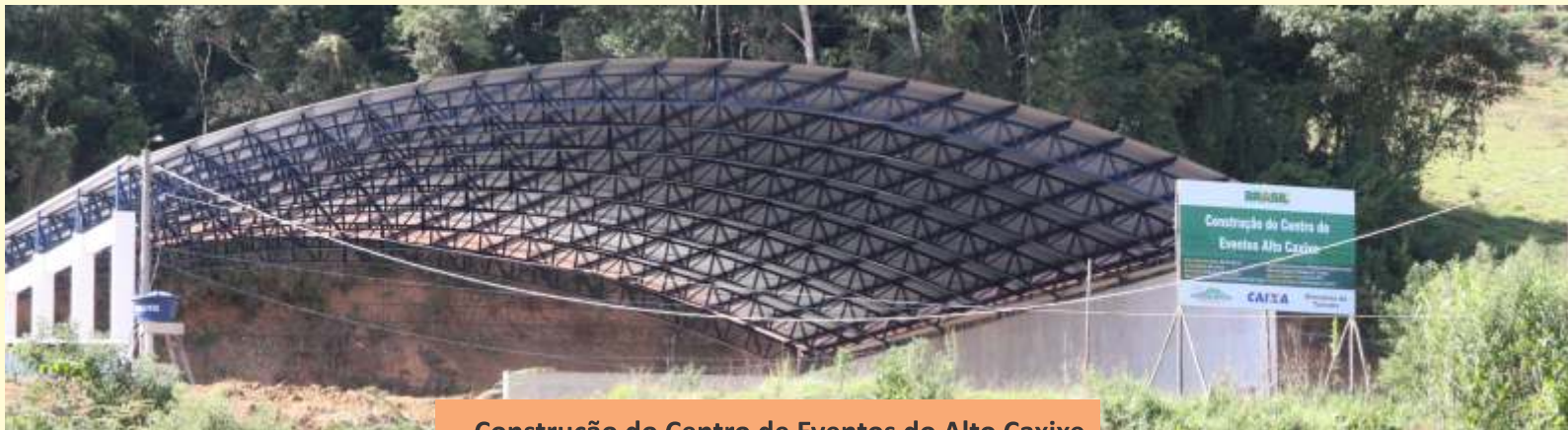
Construção do Centro de Eventos do Alto Caxixe.