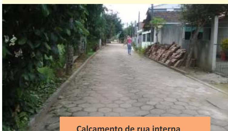
Calçamento de rua interna na Bicuíba, São João de Viçosa.