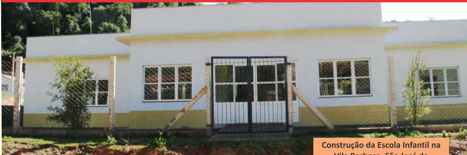
Construção da Escola Infantil na Vila Barbosa, São José do Alto Viçosa.