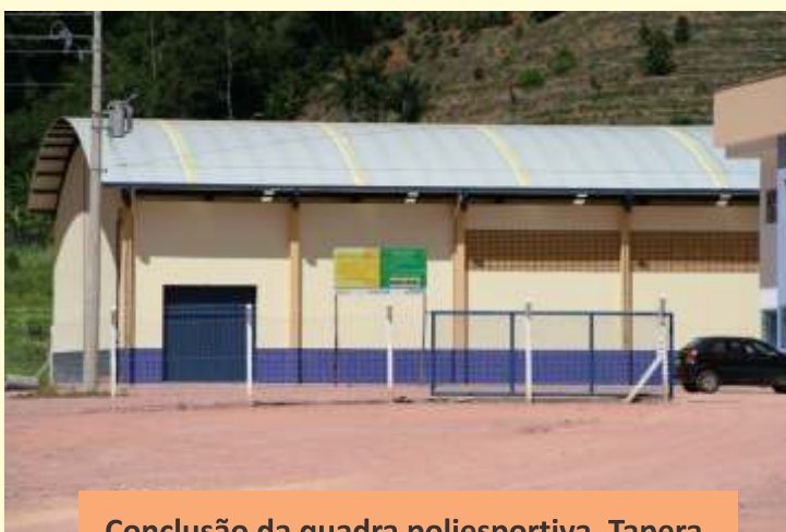
Conclusão da quadra poliesportiva, Tapera.