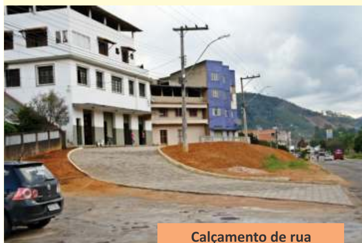
Calçamento de rua em São João de Viçosa.