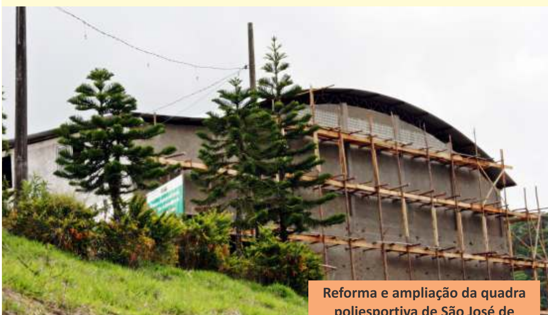
Reforma e ampliação da quadra poliesportiva de São José de Alto Viçosa.

A região também será contemplada com a elaboração de projetos para asfaltamento dos trechos: São José do Alto Viçosa X Bela Aurora e Braço do Sul via condomínio Monte Blu.