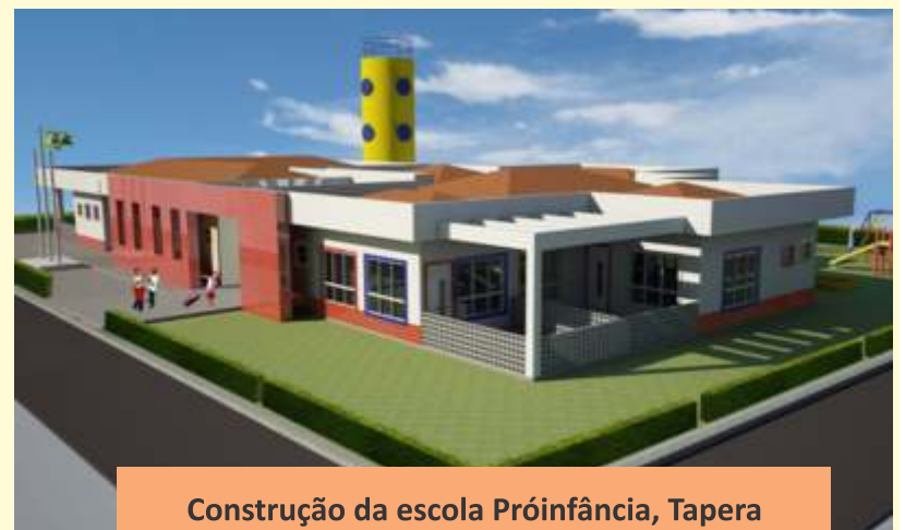
Construção da escola Próinfância, Tapera (foto ilustrativa do projeto padrão).