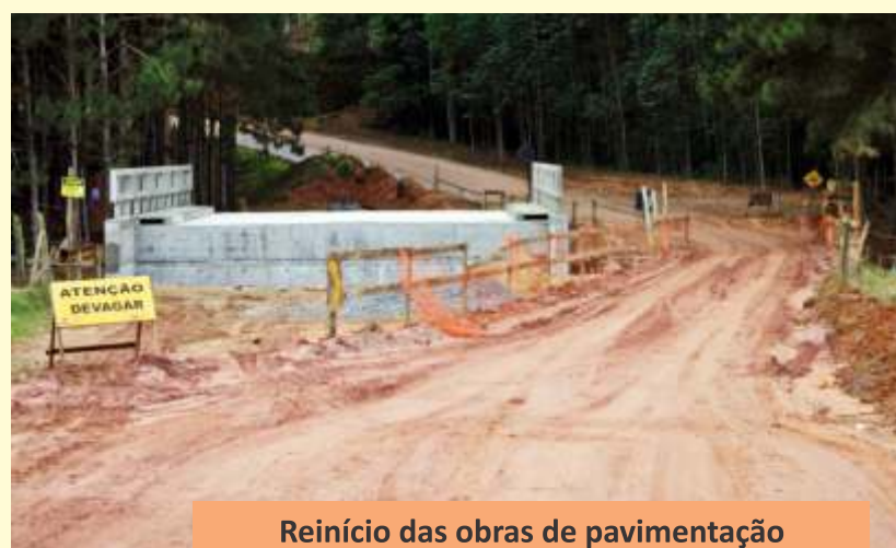
Reinício das obras de pavimentação asfáltica Viçosinha X Cachoeira Alegre.