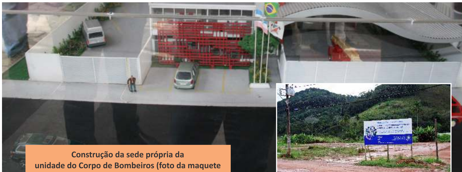
Construção da sede própria da unidade do Corpo de Bombeiros (foto da maquete da unidade padrão. Ao lado, foto do terreno onde a unidade será construída).