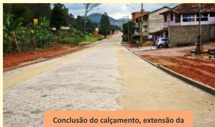
Conclusão do calçamento, extensão da Bicuíba a São João de Viçosa.